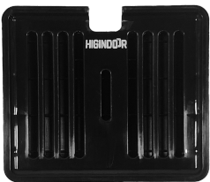
LDPOR 285 Preto