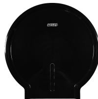
LDPHR 248 Preto