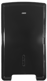
LDPTI 265 Preto