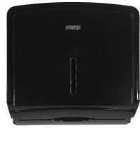
LDPTI 263 Preto