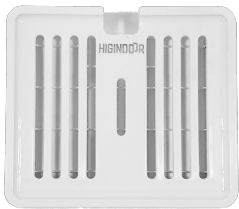
LDPOR 284 Branco

O dispenser de pastilhas odorizantes que combina elegância e eficiência! Com liberação gradual de perfume, garante um aroma agradável e duradouro em qualquer ambiente. Design moderno, praticidade e economia em um único produto para manter qualquer espaço sempre fresco e convidativo. Perfume que impressiona, funcionalidade que encanta!