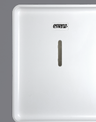
LDATR 259 Branco

Com tecnologia autocorte, o novo dispenser da Coleção Lunes® Design libera uma folha por vez, sem contato com o papel, reduzindo riscos de contaminação e desperdício. É ideal para ambientes de alto fluxo, com design moderno, materiais de alta performance e tecnologia Easy Lock para maior durabilidade. Uma solução que traduz a excelência em higiene profissional com a assinatura ALLIA.