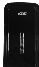
LDPHI 252 Preto