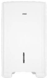
LDPTI 264 Branco

Ideal para locais com grande circulação, nosso dispenser oferece armazenamento inteligente e distribuição prática de papel toalha, reduzindo desperdícios e garantindo higiene contínua. Projetado em material super-resistente, é a escolha perfeita para ambientes que exigem durabilidade e eficiência sem igual.