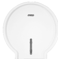
LDPHR 247 Branco

O Lunes® Design para Papel Higiênico em Rolo oferece armazenamento inteligente e acesso facilitado, garantindo praticidade, higiene e economia. Projetado para um consumo mais eficiente, evita desperdícios e protege o papel contra contaminações, mantendo-o sempre seguro e preservando a saúde do usuário.