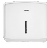
LDPTI 262 Branco

O Lunes® Design para Papel Toalha Interfolhada foi pensado para tornar a secagem das mãos mais eficiente e higiênica. Seu design arrojado e funcional armazena as folhas de forma organizada, proporcionando fácil acesso e evitando o desperdício. Além de otimizar o consumo, sua estrutura protege o papel contra impurezas, garantindo uma experiência mais segura e confortável em qualquer ambiente.