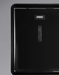
LDATR 260 Preto