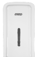
LDPHI 251 Branco

O Lunes® Design para Papel Higiênico Interfolhado combina elegância, praticidade e higiene em um design compacto, perfeito para ambientes menores. Seu design inteligente facilita o acesso ao papel, evita desperdícios e protege contra contaminações, garantindo uma experiência elegante e segura ao usuário.