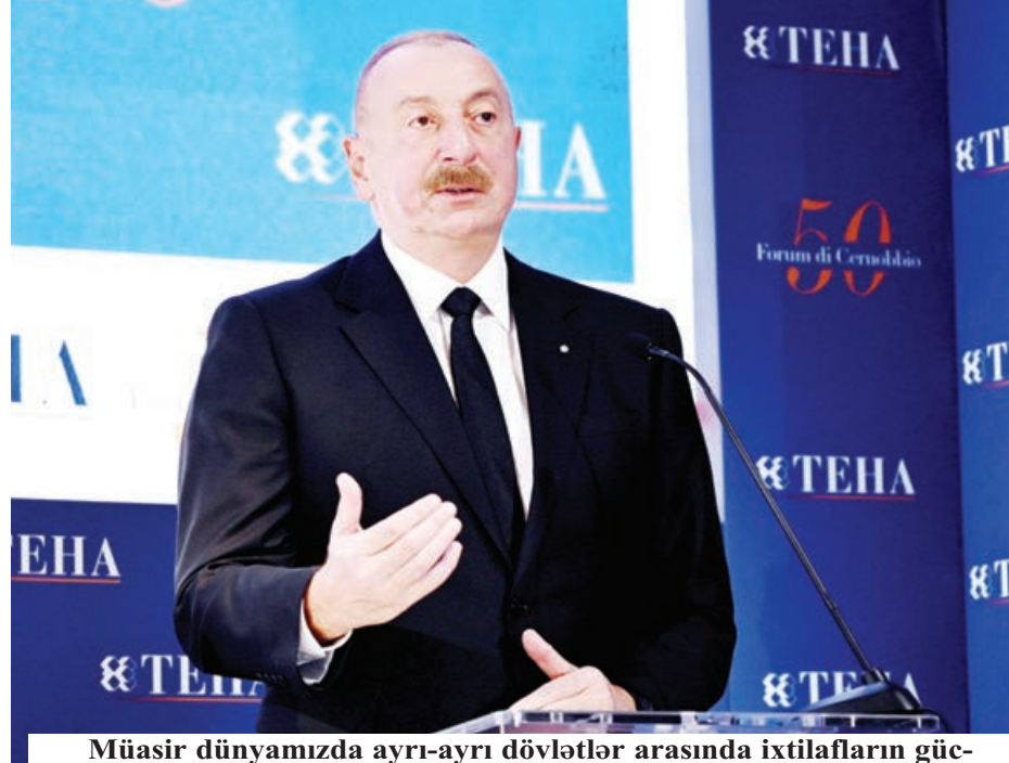
Müasir dünyamızda ayrı-ayrı dövlətlər arasında ixtilafın gücləndiyi, gərginliklərin artdığı bir zamanda Azərbaycan nənki hansısa qütbə təmsil olunur, əksinə, öz müstəqil mövqeyi, balanslı siyasəti ilə sülhə, əməkdaşlığa, qarşılıqlı maraqların aradan qaldırılmasına töhfə verməyə çalışır.

Ölkəmizlə əməkdaşlıq Avropa üçün strateji əhəmiyyətli məsələlərdəndir