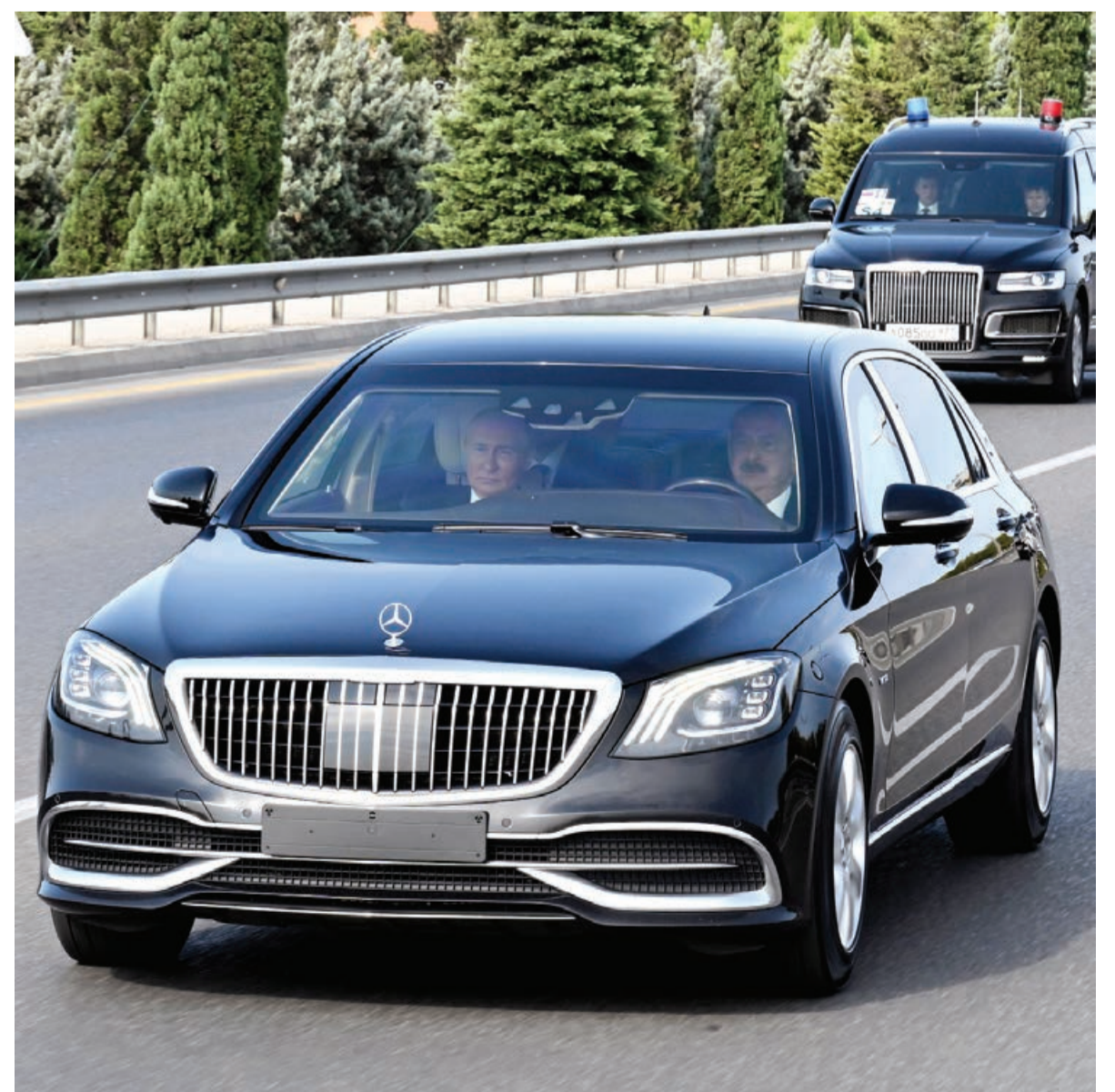
Avqustun 19-da Azərbaycan Respublikasının Prezidenti İlham Əliyev və Rusiya Federasiyasının Prezidenti Vladimir Putin "Bakı Ağ Şəhər"də olublar.